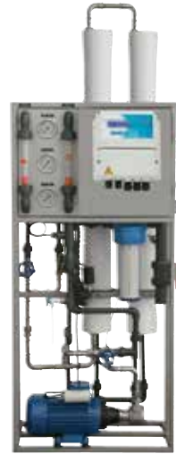
La imagen puede no representar exactamente al producto que representa.