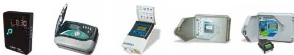
TABLA DE SELECCIÓN RÁPIDA